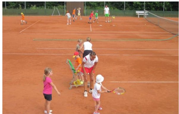
Sport Academy: drei gut besuchte Termine