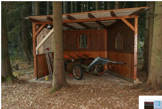
Neuer Unterstand und neue Beleuchtung beim Eglseeteich

(Bitte vormerken, es folgt keine gesonderte Einladung mehr, keine Anmeldung erforderlich!!!)