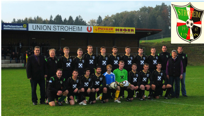
Union Stroheim Kampfmanschaft 2011/12