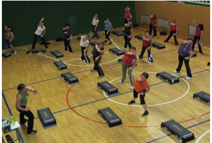
oben: der „alte“ Turnsaal